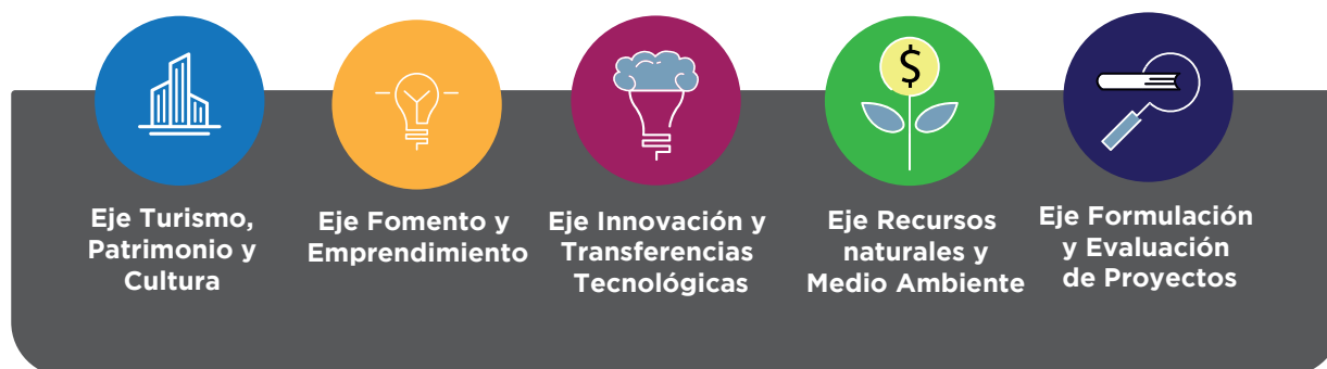
Figura nº 1: Ejes Estratégicos CRDT – 2023.

Estos ejes de acción trabajan de forma conjunta para ofrecer asistencia a todos los sectores de la comunidad y, desde instituciones gubernamentales hasta pequeñas y medianas empresas, gremios, juntas de vecinos, fundaciones, centros culturales y clubes deportivos, entre otros.