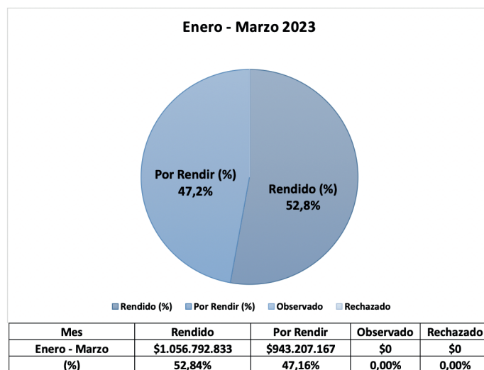
Gráfico nº 1: Avance de la ejecución presupuestaria bajo el POA CRDT 2022-2023, periodo 1er trimestre:

Así, durante el trimestre enero a marzo del 2023, se rindió un total de $ 1.056.792.833.-, lo que equivale a un 52,84% (ver gráfico nº 1). Faltando por rendir $943.207.167.- Importante es mencionar que en el periodo hubo 0% de recursos rechazados y 0% de observados.