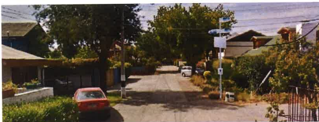
Fotomontaje referencial de sistema de televigilancia residencial