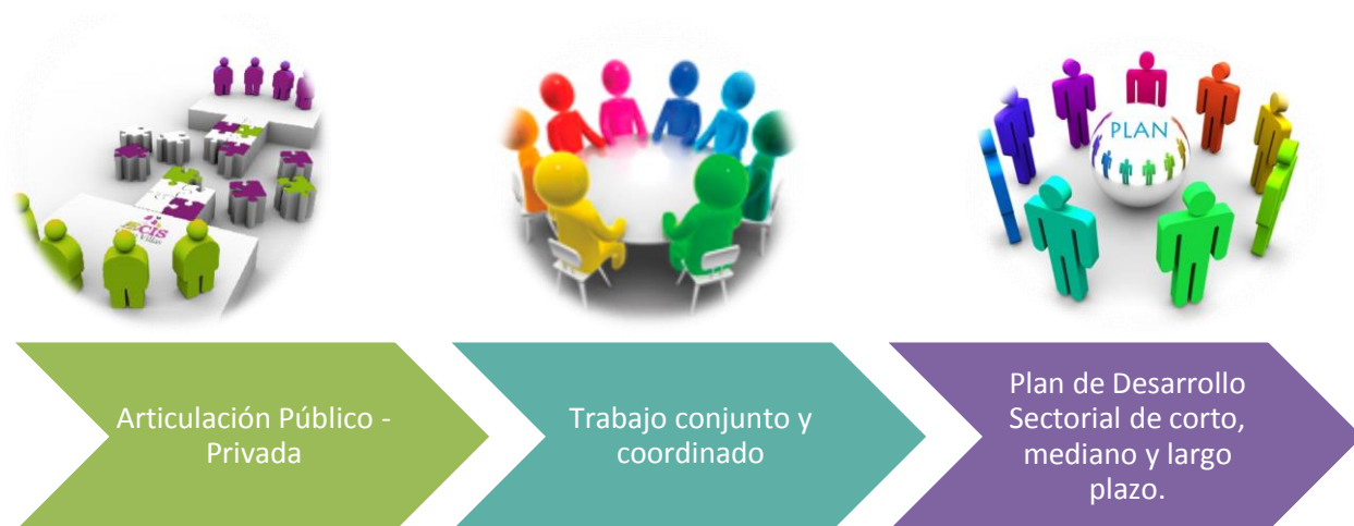
Figura N°3: Estrategia de Trabajo para las líneas de acción de los ejes estratégicos de la CRDPT.

La definición de esta estrategia, busca coordinar esfuerzos con el fin de lograr un plan de trabajo participativo, coordinando las distintas políticas institucionales y los recursos que se destinen a los distintos sectores productivos regionales, evitando la dispersión de acciones aisladas de bajo impacto, no generadoras de cambios. Conduciendo a la complementariedad y no a la competencia, de manera de lograr mayor eficiencia y eficacia de la gestión regional y de los recursos públicos y privados involucrados, donde cada organismo cumple un rol dentro del plan, con ejecución de acciones y recursos dentro de su ámbito de competencia, que sumado a los roles de los demás participantes, conducirán al cumplimiento del Plan de Desarrollo del Sector de manera integral.